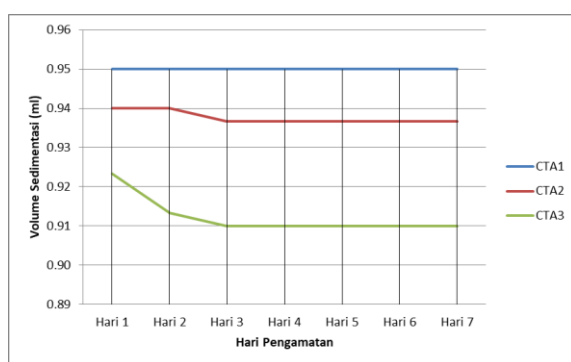
Gambar 2. Grafik kecepatan sedimentasi sediaan suspensi cangkang telur ayam (CTA)

bobot jenis yang baik untuk suspensi. Pada sediaan suspensi, jika pembawa yang digunakan adalah air, maka massa jenis yang dihasilkan umumnya lebih besar daripada massa jenis pembawanya dan merupakan sifat yang diharapkan 11 .