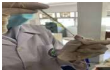
Gambar 1. Pemberian Sediaan Secara Oral

Pengamatan dilakukan dengan penentuan onset diare, durasi diare, frekuensi diare, konsistensi diare dan bobot feses.