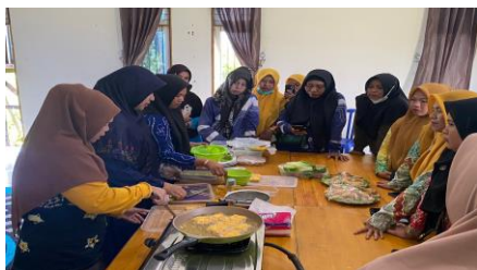
Gambar 6. Pengolahan nugget kelor

Pelatihan merupakan metode yang memberikan kesempatan kepada kader Posyandu untuk meniru dan memperagakan ulang segala hal yang telah disampaikan pada kegiatan pelatihan 8 . Metode pelatihan ini bertujuan melatih keterampilan kader dalam mempraktikkan secara langsung kegiatan pada masyarakat 9 .