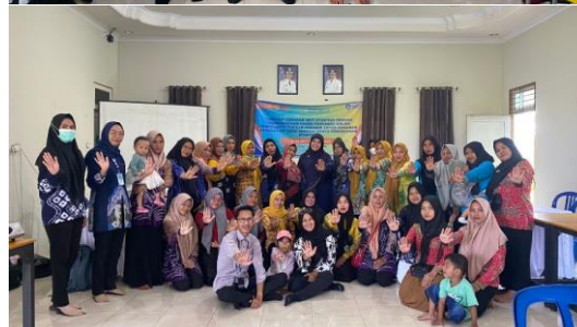
Gambar 3. Foto Bersama Peserta dan Pihak Kecamatan Tatah Makmur

Berdasarkan hasil pre test dan post test didapatkan peningkatan pengetahuan kader yang tersaji pada gambar 1 dan gambar 2.