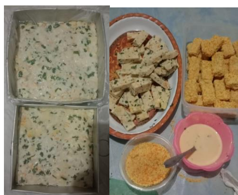
Gambar 7. Paket nugget kelor dan hasil pengolahan secara mandiri oleh kader