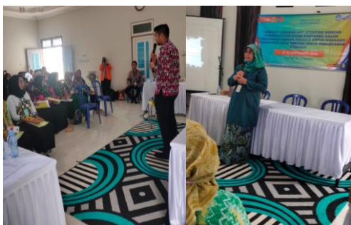
Gambar 1. Edukasi Stunting dan Pernikahan Dini dan PIRT