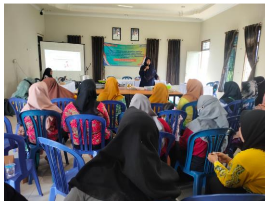
Gambar 2. Edukasi Pangan Sehat