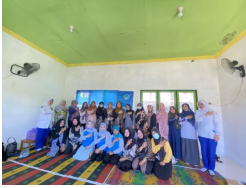
Gambar 1. Kegiatan Edukasi dan Pelatihan Kader Posyandu di Kelurahan Pemurus Dalam

Peningkatan pengetahuan peserta menunjukkan bahwa pelatihan partisipatif berbasis community empowerment efektif dalam memperkuat pemahaman dan keterampilan kader posyandu terkait deteksi dini risiko kehamilan. Efektivitas tersebut dipengaruhi oleh beberapa faktor kunci. Pertama, penggunaan metode interaktif mendorong keterlibatan aktif peserta sehingga materi tidak hanya diterima secara pasif, tetapi juga dipahami melalui diskusi dan simulasi. Kedua, pemanfaatan media visual seperti video edukasi dan leaflet membantu memperkuat memori jangka panjang dan mempermudah pemahaman konsep risiko secara lebih konkret. Ketiga, dukungan dari tenaga kesehatan puskesmas serta pengurus PKK menciptakan suasana belajar