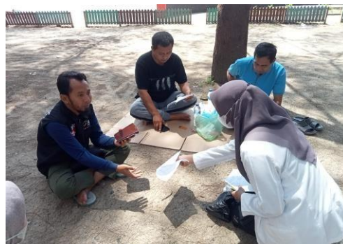
Gambar 3. Pembagian Leaflet