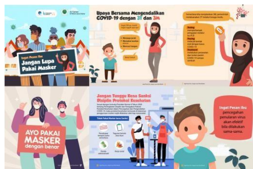
Gambar 2. Leaflet Ingat Pesan Ibu 3 M

Kegiatan berlangsung di Pantai Rindu Alam Pagatan, kegiatan ini menggunakan leaflet ingat pesan ibu 3M serta pembagian masker. Kegiatan dilaksanakan pada tanggal 5 Februari 2022 dengan total pengunjung 24 orang. Pengunjung berasal dari Kabupaten Tanah Bumbu sebanyak 24 orang, yang terdiri dari 15 orang perempuan dan 9 orang laki-laki. Selama kegiatan tim membagikan leaflet beserta masker kepada pengunjung.