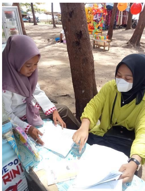
Gambar 4. Pembagian Leaflet