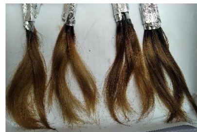
Gambar 2. Hasil pewarnaan rambut

dapat mempengaruhi terjadinya penurunan warna pada sampel rambut. Rambut yang sering terpapar sinar ultraviolet akan mengalami perubahan warna dari hitam menjadi kemerahan. Perubahan warna yang terbentuk pada rambut ini disebabkan oleh panas sinar matahari yang menghancurkan pigmen warna hitam yang terdapat pada rambut sehingga warna F0 , F1 dan F2 , F3 an menurun (24) .