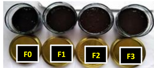
Gambar 1. Sediaan Pewarna Rambut yang dihasilkan

yang khas pada semua formula. Sediaan yang dihasilkan dapat dilihat pada gambar 1.