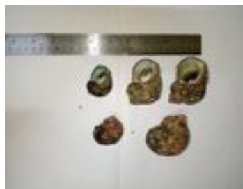
Gambar 1. Sampel Kerang Mata Lembu

Sampel Kerang Mata Lembu ( T. setosus ) yang berhasil dikumpulkan sebanyak 4,15 Kg. Ukuran kerang bervariasi dengan diameter 3-7 cm. Bagian pelindung dagingnya berbentuk bulat berwarna hitam, mirip mata sapi atau lembu (Gambar 1). Kerang dalam keadaan hidup dibawa ke Laboratorium dengan penambahan es, ini bertujuan agar kerang tetap segar sampai diberi perlakuan berikutnya.