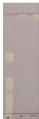
Gambar 2. Hasil identifikasi senyawa antioksidan melalui pereaksi semprot (DPPH)

Pada analisis aktivitas antioksidan secara kualitatif menggunakan kromatografi lapis tipis (KLT) yang dapat dilihat pada gambar 2. Filtrat yang sudah di elusi pada plat silika dengan fase gerak kloroform : etil asetat : metanol : asam format (2 : 7 : 0,5 : 0,5), kemudian plat yang telah dielusi disemprot dengan larutan radikal bebas stabil 2,2-difenil-1-pikrilhidrazil (DPPH) dalam etanol. Radikal DPPH memiliki warna ungu tua yang khas dan ketika bereaksi dengan senyawa radikal scavenger seperti fenol dan flavonoid akan menerima atom hidrogen atau elektron sehingga tereduksi menjadi bentuk non-radikal yang berwarna bercak kuning pada latar belakang ungu di posisi senyawa antioksidan dari plat KLT. Hal tersebut menunjukkan keberadaan komponen yang memiliki kemampuan penangkap radikal (Giri et al., 2020; Muthia et al., 2020).